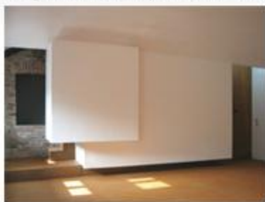
Imagen de video capturada en vivo