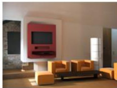
Imagen resultante procesada en vivo